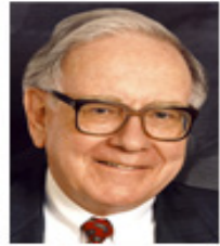
Warren Buffett 沃伦·巴菲特