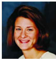
Melinda Gates 梅琳达·盖茨